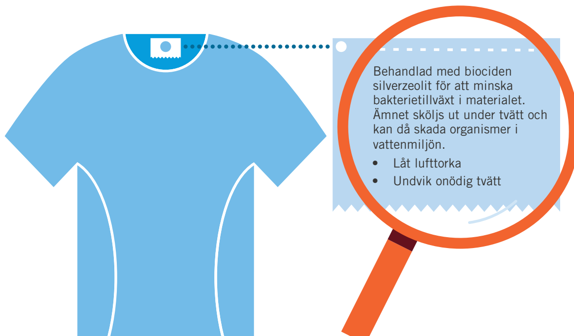
Biocidbehandlade varor ska vara märkta på ett särskilt sätt. Här är ett exempel på märkning av en biocidbehandlad vara.

för att motverka till exempel bakterier, mögelsvampar eller insekter.